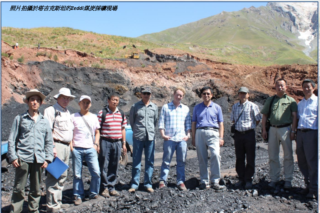
照片拍攝於塔吉克斯坦的Zeddi煤炭採礦現場

由2011年7月30日至8月7日，新疆煤田地質局的代表團對凱順在塔吉克斯坦的煤炭資產作出了廣泛的現場參觀。參觀礦區目的是讓新疆煤田地質局了解凱順在塔吉克斯坦的煤炭資產，從而尋求雙方就這些資產的潛在合作方式。