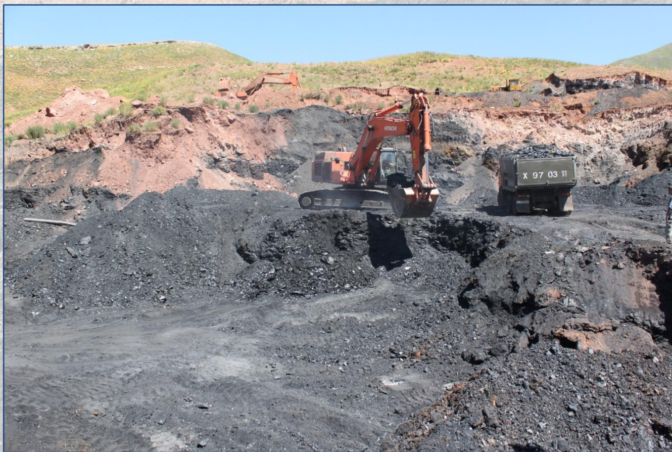
Zeddi 的動力煤開採進行情況