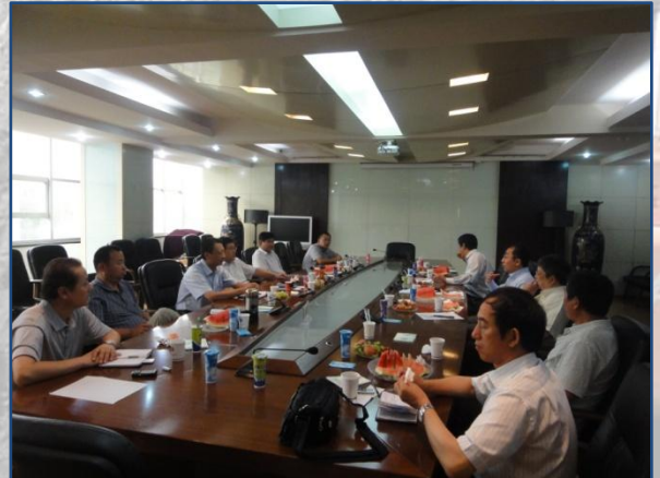
凱順能源和新疆煤田地質局之間就潛在合作已經取得了顯著的進展和了解