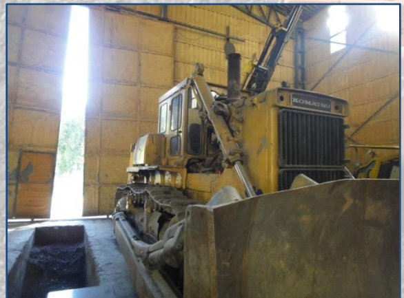
我們在Kaftar Hona用於存儲的基建（左）和準備調配的推土機（右）的圖片