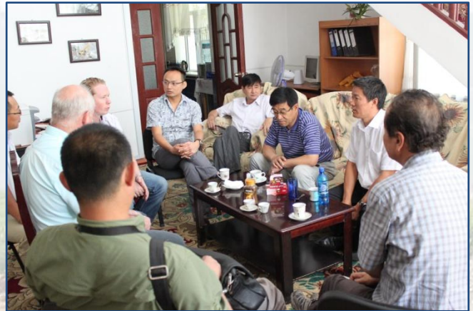
現場參觀後，新疆煤田地質局與凱順能源就塔吉克斯坦煤炭資產潛在合作方式所進行的討論